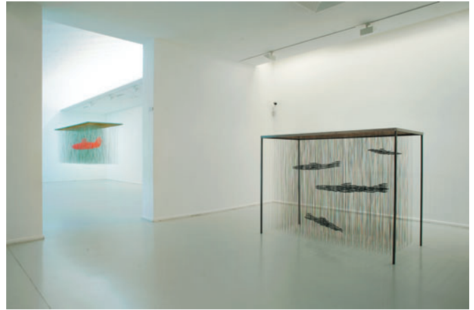
Riera i Arago, Quatre sous-marins , détail et vue d'ensemble

disques noirs, de part et d'autre de la fente, sont des empreintes qui révèlent la trame et la pliure du tissu. Cette empreinte recto-verso d'un corps géométrique, n'est pas sans évoquer celle du Suaire de Turin.