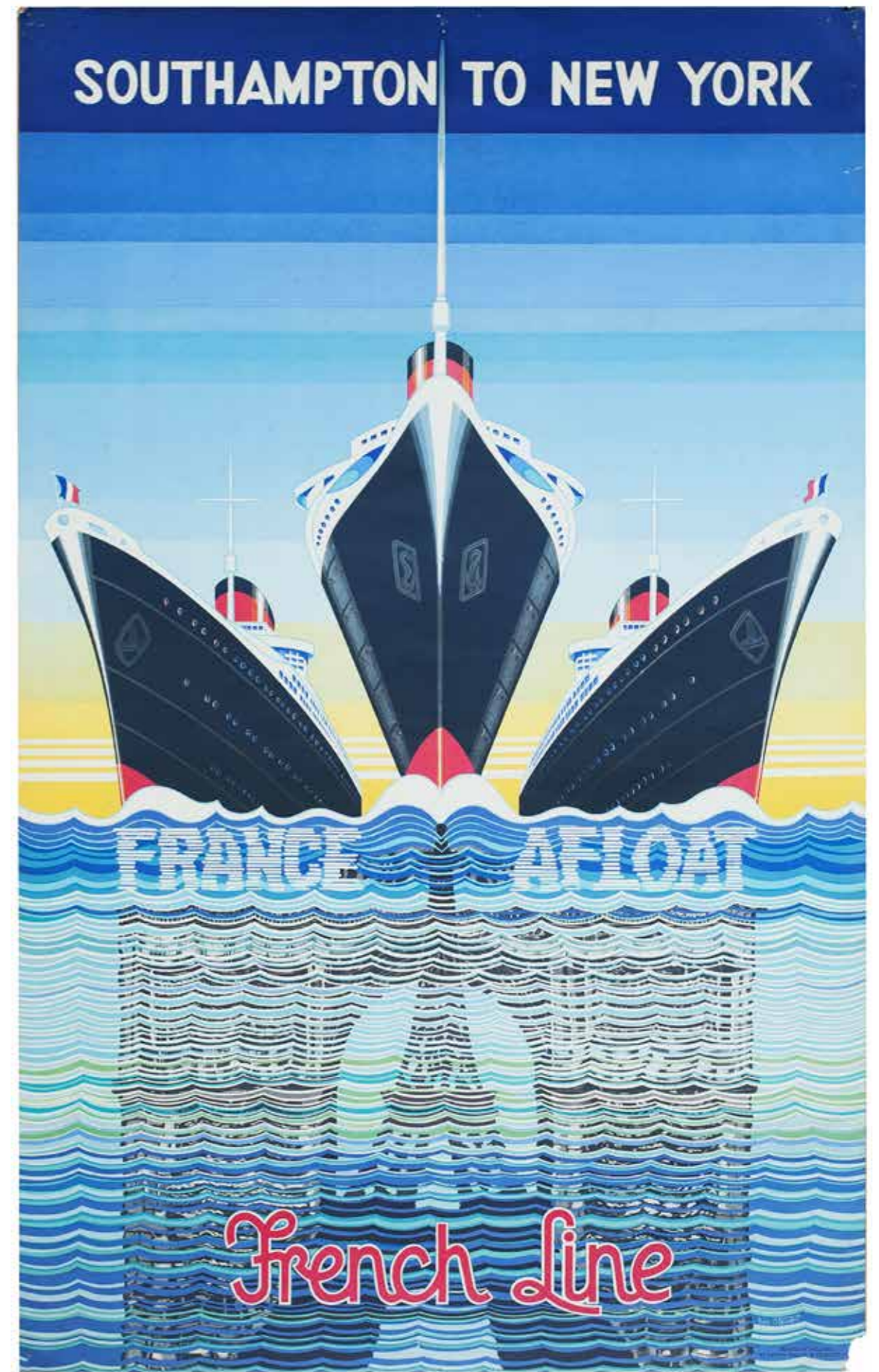
Kay Stewart Southampton to New York. France Afloat, affiche publicitaire de la Compagnie générale transatlantique, vers 1938

Épreuve gélatino-argentique, tirage d'époque, 29,4 x 29,5 cm, Los Angeles, The J. Paul Getty Museum