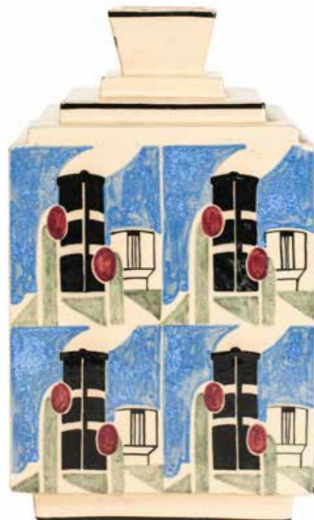
Robert Lallemant Transatlantique , entre 1926 et 1933

Huile sur toile, 103 x 132,5 cm, collection du Musée de Grenoble © Adagp, Paris 2025