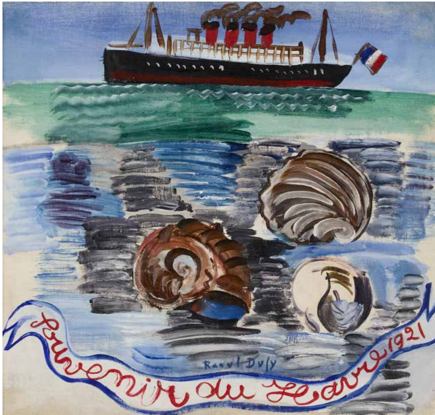
Raoul Dufy Souvenir du Havre, 1921 Huile sur toile, 35,5 x 38,5 cm, Le Havre, musée d'art moderne André Malraux