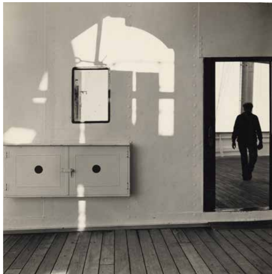
Walker Evans Liberté : Promenade Deck, Port Forward

Épreuve gélatino-argentique, 25,3 x 22,1 cm, Paris, centre Pompidou, musée national d'art moderne / Centre de création industrielle