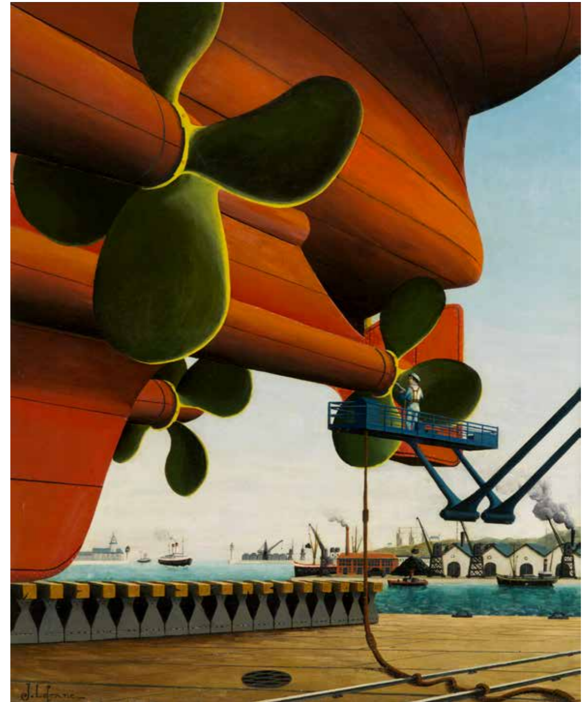
Jules Lefranc Sur le plateau , atelier de la Radiale, 1949

Clémence Poivet-Ducroix , attachée de conservation au MuMa – musée d'art moderne André Malraux au Havre