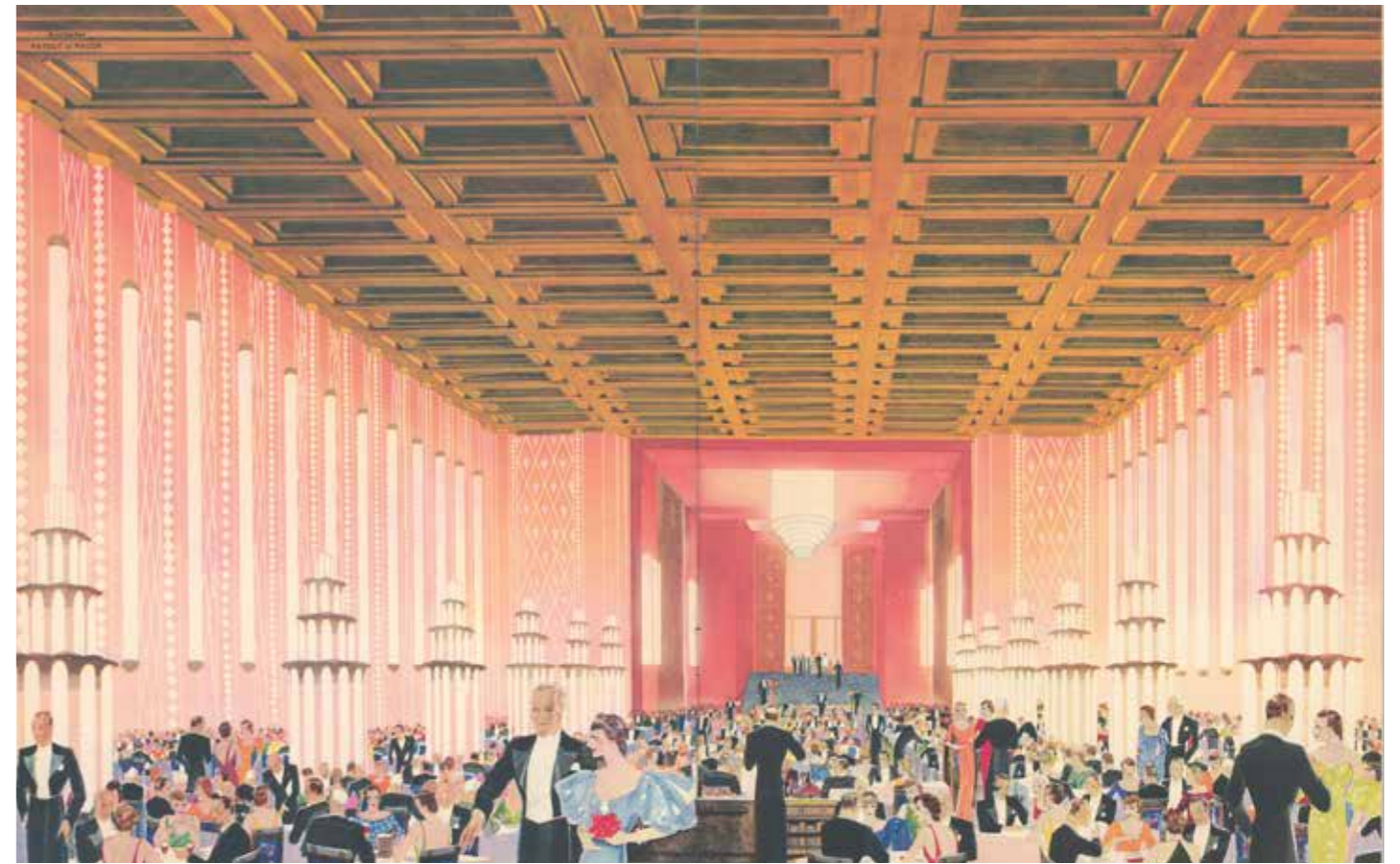
Paul Iribe La salle à manger de la première classe de Normandie, brochure publicitaire de la Compagnie Générale Transatlantique, vers 1935

Papier cartonné imprimé, 30,5 x 24,3 x 0,4 cm, collection Saint-Nazaire Agglomération Tourisme – Ecomusée