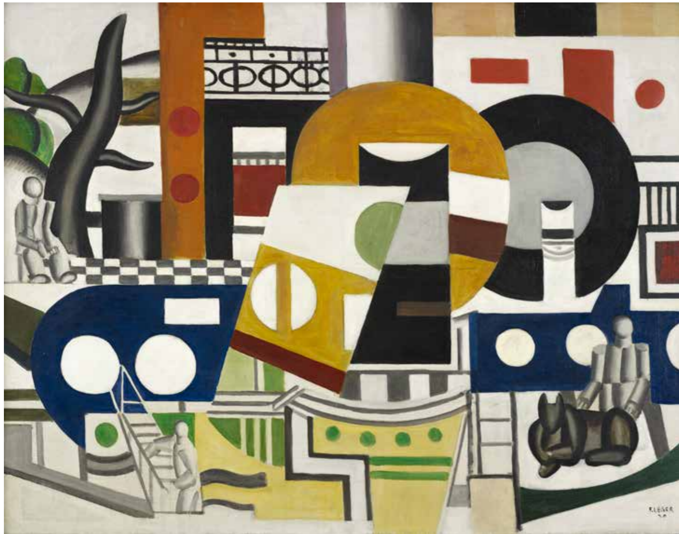
Fernand Léger Le Remorqueur , 1920

Huile sur toile, 103 x 132,5 cm, collection du Musée de Grenoble © Adagp, Paris 2025