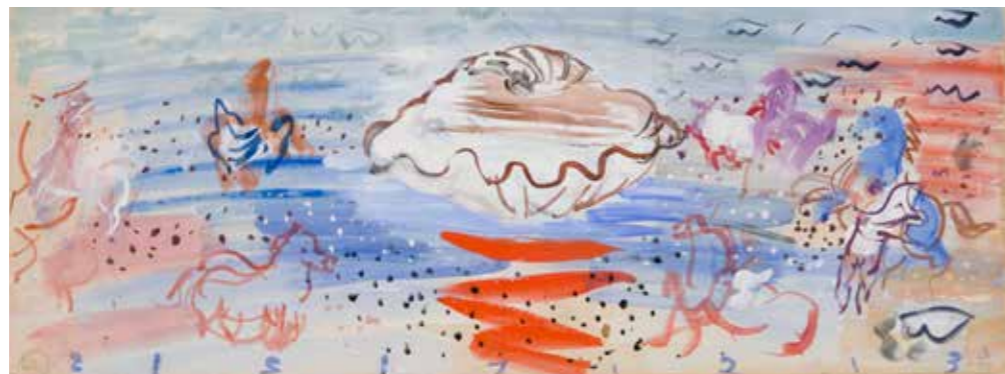
Raoul Dufy Coquillage et chevaux. Étude pour le décor de la piscine du paquebot Normandie, 1935 Gouache sur papier, 25 x 66 cm, Paris, Centre Pompidou, musée national d'art moderne, dépôt au musée d'art moderne André Malraux