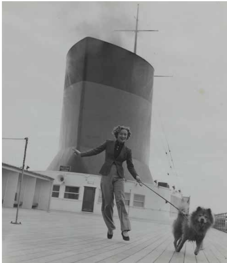
Jean Moral Modèle sur le Normandie, vers 1935

Épreuve gélatino-argentique, 25,3 x 22,1 cm, Paris, centre Pompidou, musée national d'art moderne / Centre de création industrielle