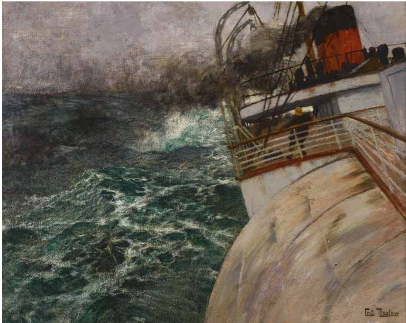
Frits Thaulow Le Vapeur transatlantique , 1898

Huile sur toile, 55 x 81 cm, acquisition de la Ville du Havre avec l'aide du FRAM Le Havre, musée d'art moderne André Malraux