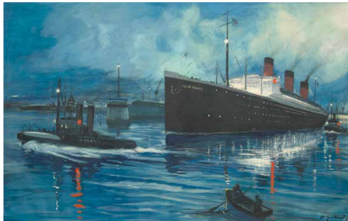
André Galland Île de France sortant du Port du Havre , 1931

Huile sur toile, 55 x 81 cm, acquisition de la Ville du Havre avec l'aide du FRAM Le Havre, musée d'art moderne André Malraux