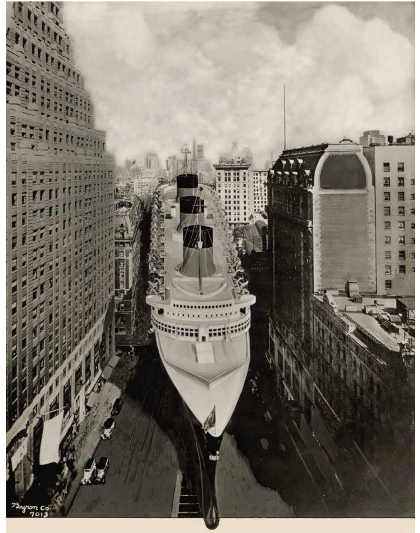
Byron Compagny Normandie dans la 5e avenue , photomontage, vers 1935

Céramique, 26,5 x 15,5 cm, Le Havre, musée d'art moderne André Malraux