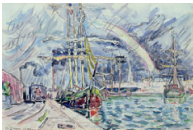
8. Saint-Malo, Le Viana , 15 mars 1930. Aquarelle. H. 30,2 x L. 45,2 cm