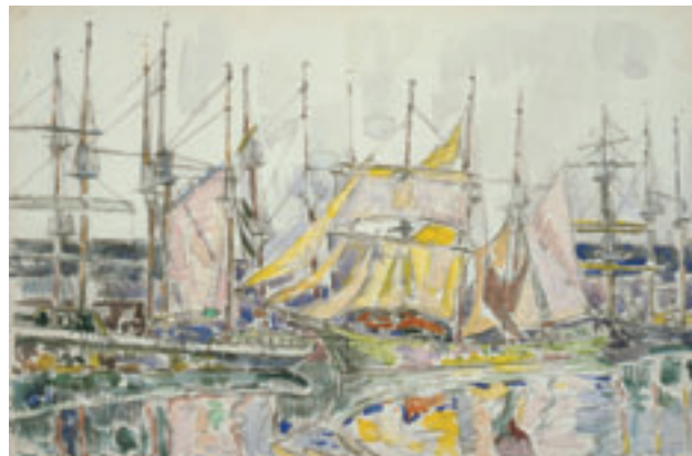
12. Saint-Malo , octobre 1929. Gouache fusain et aquarelle sur papier. H. 29 x L. 44 cm