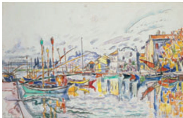
14. Martigues . Probablement avril 1929. Mine de plomb et aquarelle. H. 27,7 x L. 43,5 cm

Little Rock, Arkansas Arts Center Foundation. Gift of James T. Dyke 1999.065.089 (LH)