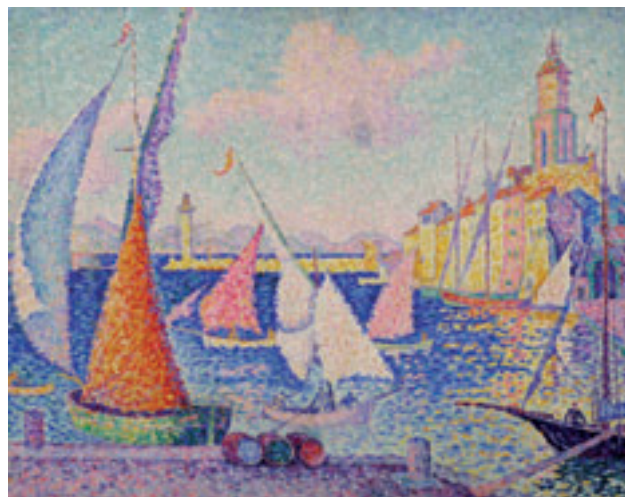
2. Saint-Tropez, le quai . 1899. Huile sur toile. H. 65 x L. 81 cm Saint-Tropez, musée de l'Annonciade