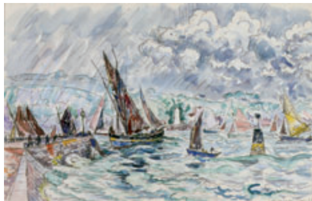
6. Concarneau, les thoniers, juin 1929 . Aquarelle. H. 28,8 x L. 44,7 cm Collection particulière