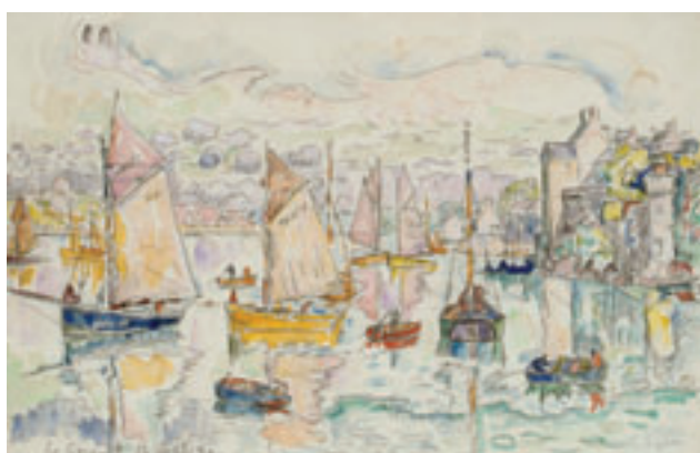
9. Le Conquet , 12 septembre 1930. Aquarelle. H. 27,6 x L. 43,5 cm