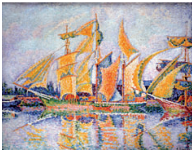
3. Trois mâts terre-neuvas. Voiles au sec. Saint-Malo . 1931. Huile sur toile. H. 73 cm x L. 92 cm Collection particulière