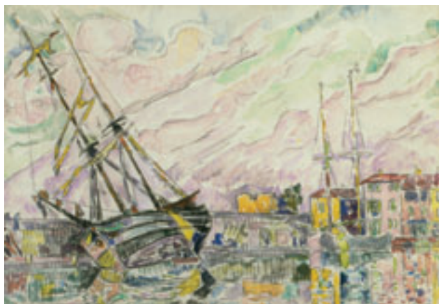
13. Saint-Tropez . Probablement avril 1931. Aquarelle. H. 29 x L. 42 cm