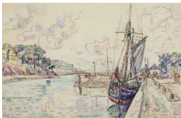
11. Rivière de Tréboul , 13 juin 1929. Aquarelle. H. 29,6 x L. 45 cm