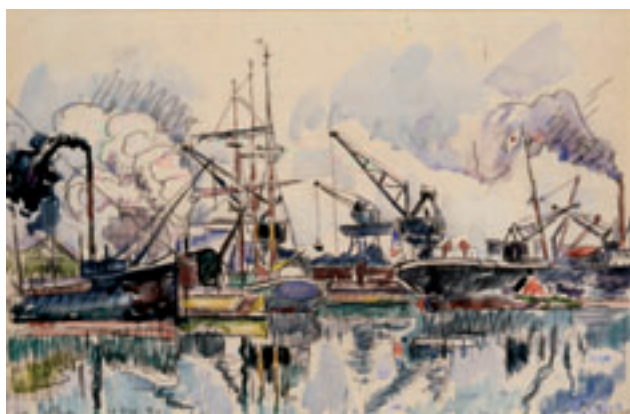
7. La Pallice , 10 novembre 1930. Aquarelle. H. 28,5 x L. 43,7 cm