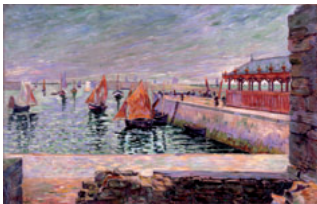
1. Port-en-Bessin, la halle aux poissons . 1884. Huile sur toile. H. 59 x L. 91,5 cm Collection particulière.