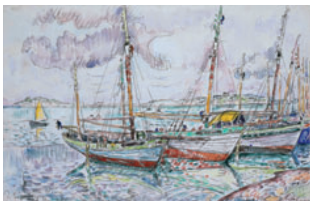
15. Ile-aux-Moines , mai 1929. Mine de plomb et aquarelle. H. 28 x L. 43,3 cm

Little Rock, Arkansas Arts Center Foundation. Gift of James T. Dyke 1999.065.089 (LH)