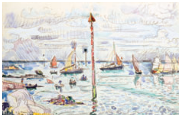
4. Barfleur, 23 juin 1930 . Aquarelle. H. 28 x L. 44 cm Collection particulière