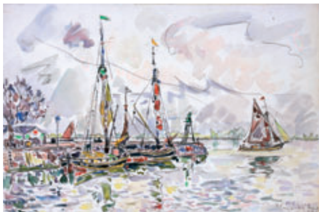
5. Blaye, 13 avril 1929 . Aquarelle. H. 29,3 x L. 43,8 cm Collection particulière