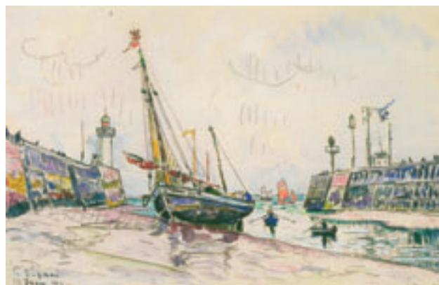
10. Le Tréport , 13 juin 1930. Aquarelle. H. 29 x L. 44,5 cm