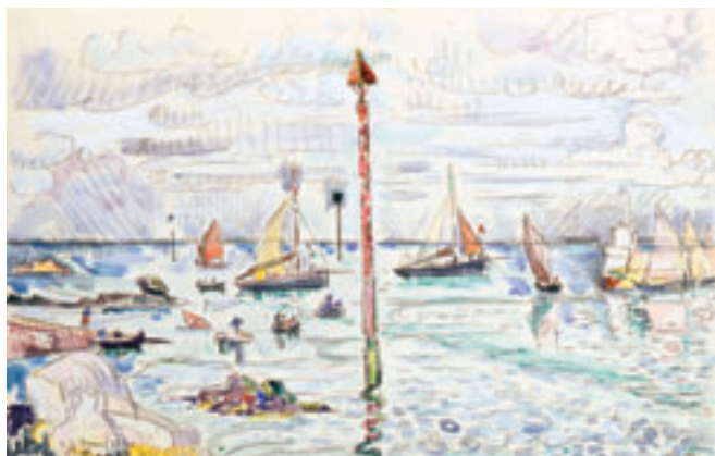
Barfleur, 23 juin 1930 Aquarelle. H. 28 x L. 44 cm Collection particulière

donnée au musée de Little Rock dans l'Arkansas), toutes les pièces de cette série, connues à ce jour, soit environ 90, seront confrontées à quelques-uns des grands modèles qui l'ont inspirée : œuvres d'artistes particulièrement admirés par Signac (Le Lorrain, Joseph Vernet, Corot, Jongkind, Boudin...). Des peintures de la période impressionniste, néo-impressionniste puis de celle qui s'ouvre avec son installation à Saint-Tropez en 1892, viendront rappeler l'attachement profond de Signac, marin lui-même, au monde des ports.