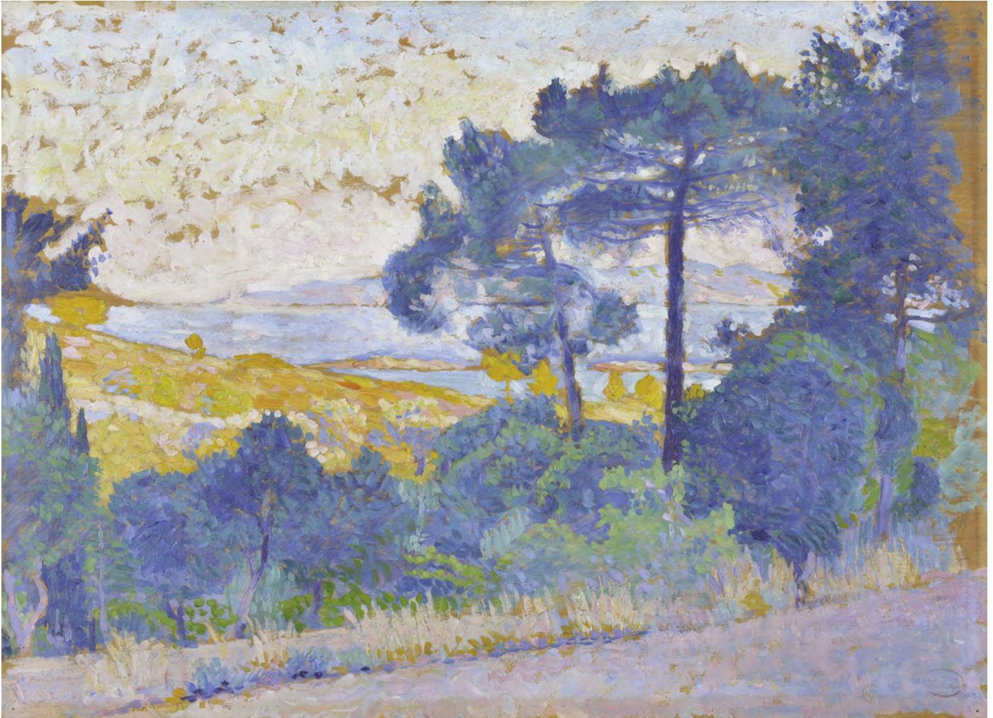
Henri-Edmond Cross, Étude pour Paysage provençal , 1898. Huile sur bois © 2015 MuMa Le Havre / Charles Maslard.