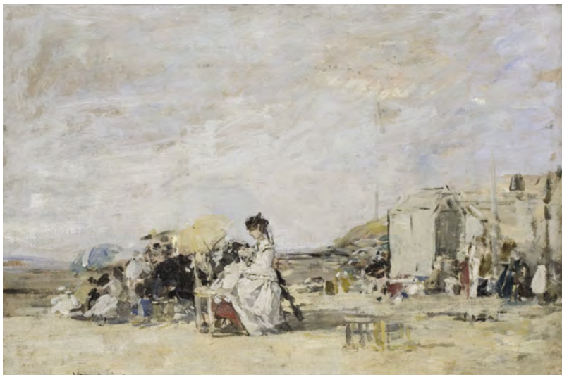
Eugène Boudin, Dame en blanc sur la plage de Trouville Huile sur carton © 2005 MuMa Le Havre / Florian Kleinfenn.